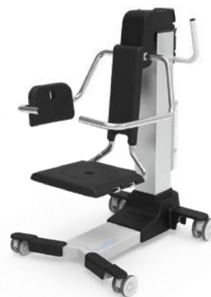
Hydraid jako siedzisko