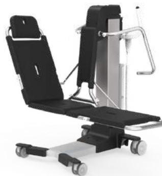
Hydraid jako leżysko