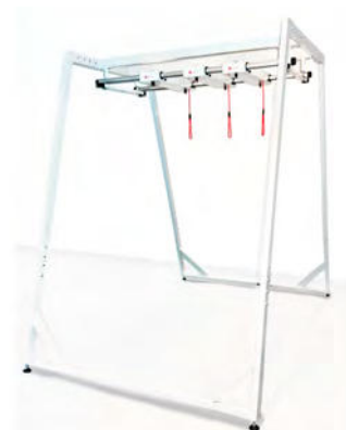
100203 Redcord Workstation Professional Floor Stand z 3 trawersami