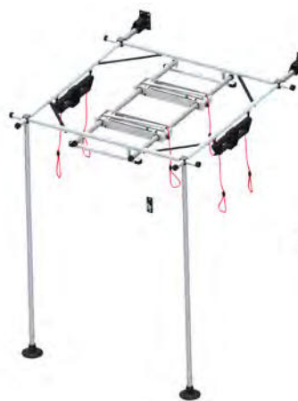
100103 Redcord Workstation Professional Wall Stand z 3 trawersami