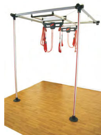
100102 Redcord Workstation Professional Wall Stand z 2 trawersami